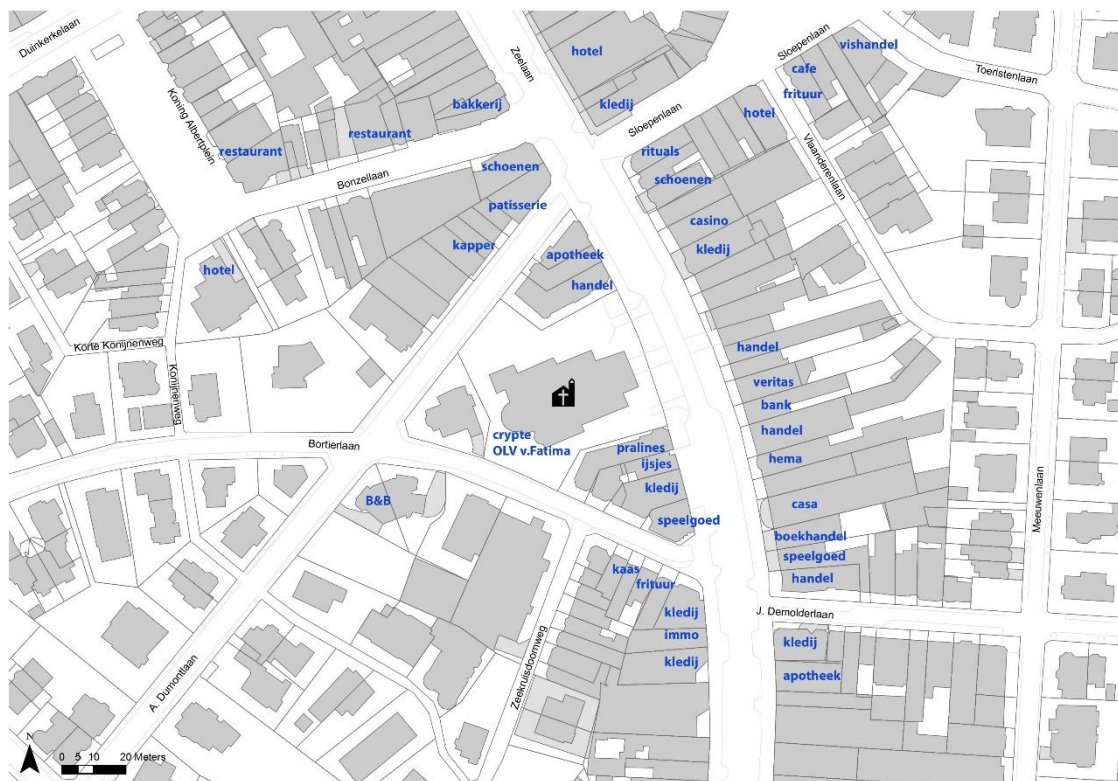
kaart 2:

De kerk is gelegen vlakbij zee en niet ver van het gemeentehuis, een basisschool, een cultuurhuis en het natuurreservaat Houtsaegerduinen. Er zijn heel wat handelsgebouwen in de buurt. Er zijn verschillende parkeerplaatsen vlakbij.