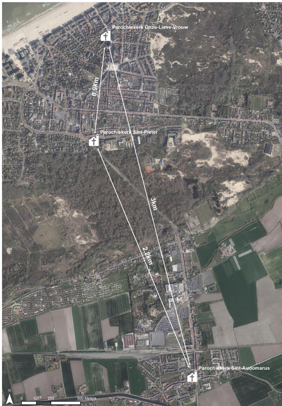
kaart 1: Samenvattende overzicht

De kerken zijn allen aangeduid als vastgesteld bouwkundig erfgoed. De Onze-Lieve-Vrouwkerk en voormalige pastorie maken deel uit van het beschermd dorpsgezicht de Dumontwijk.