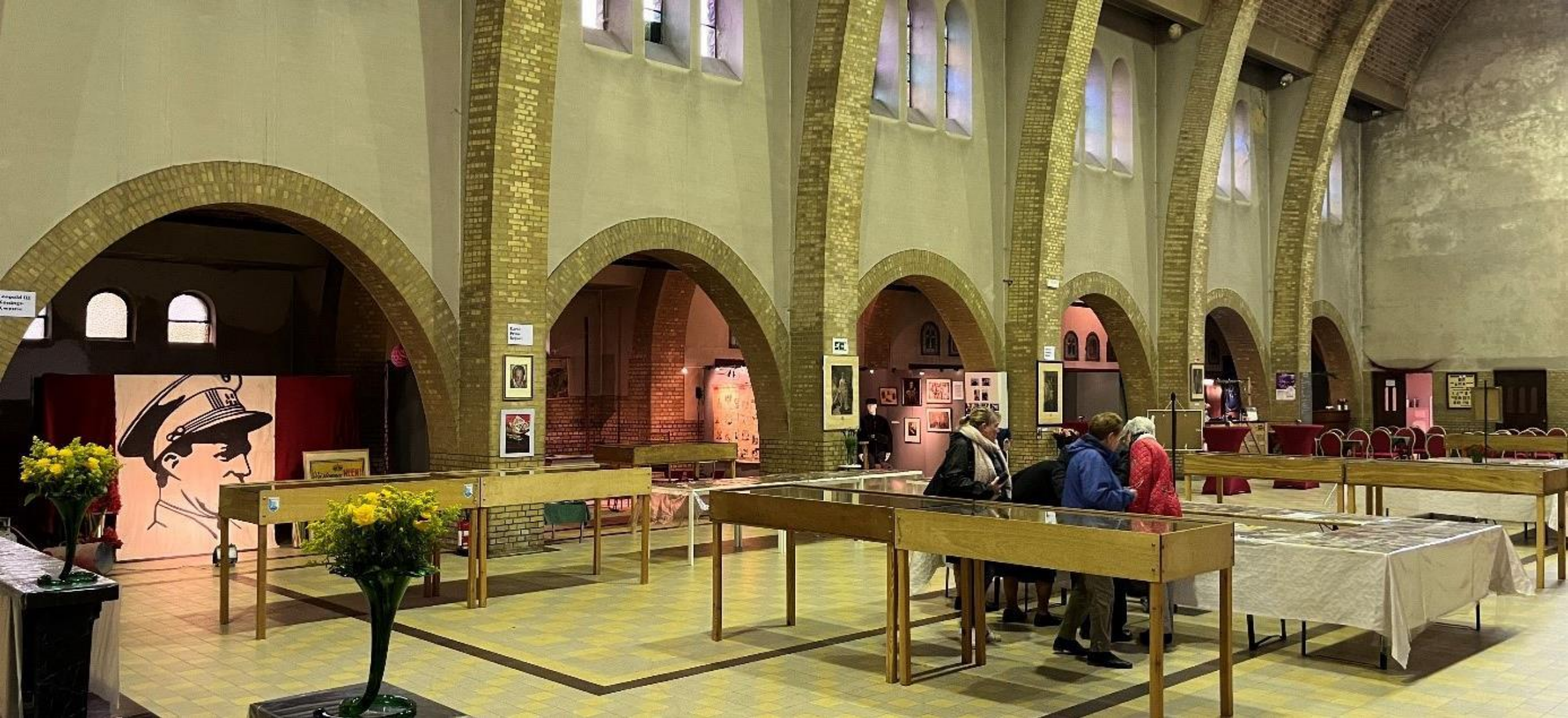
Heilig Kruiskerk Lebbecke