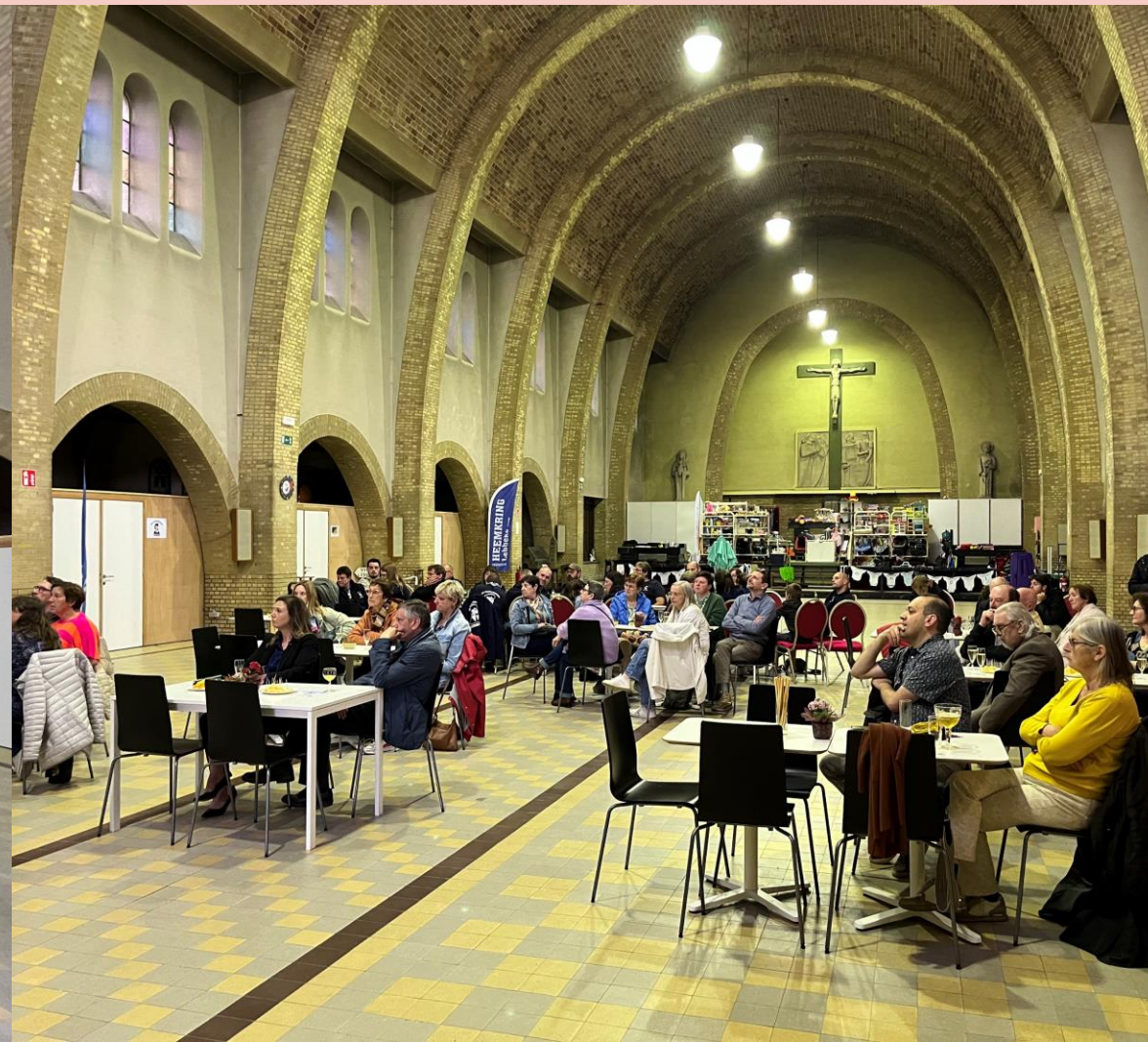
Heilig Kruiskerk Lebbecke